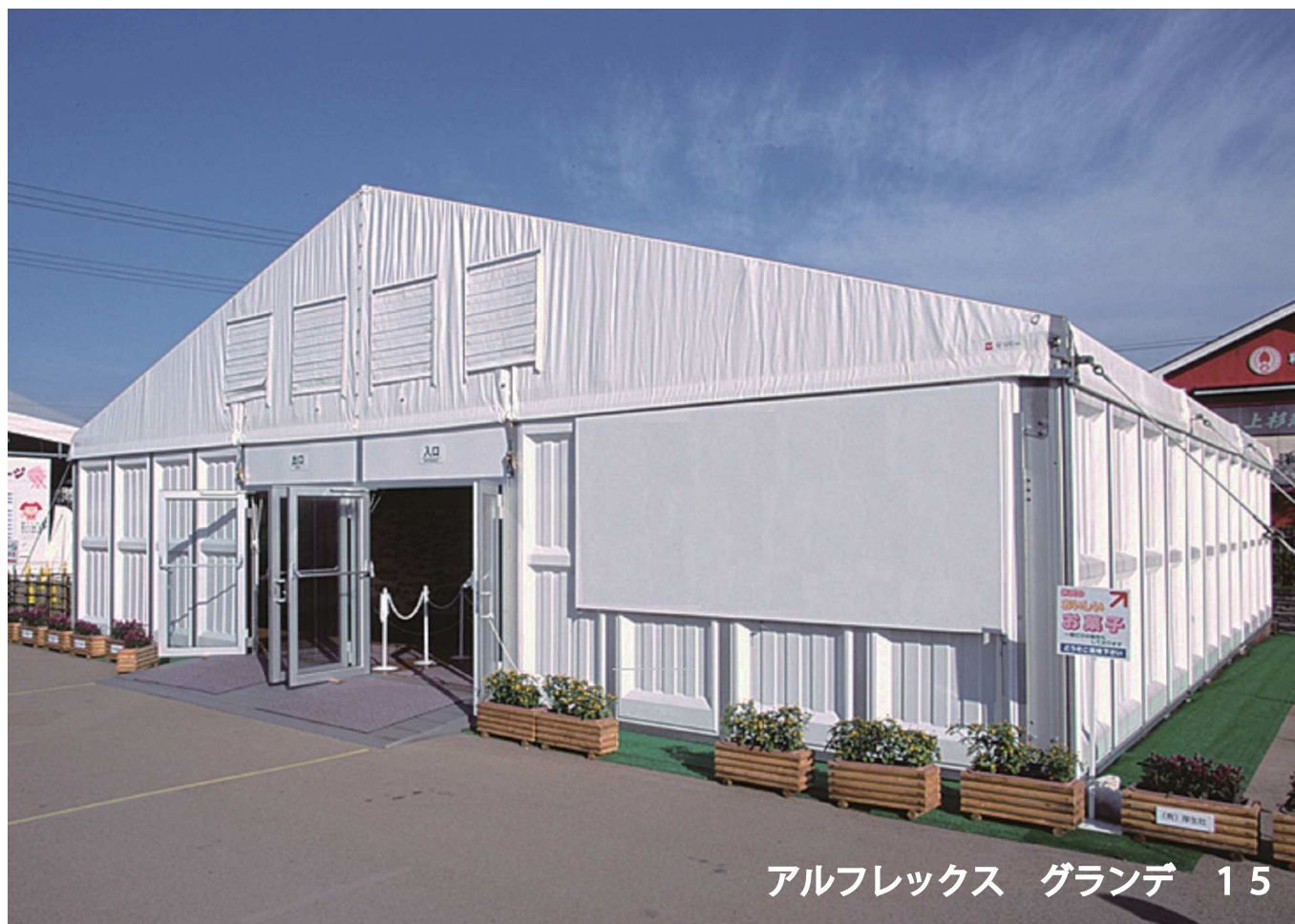
アルフレックス グランデ 15