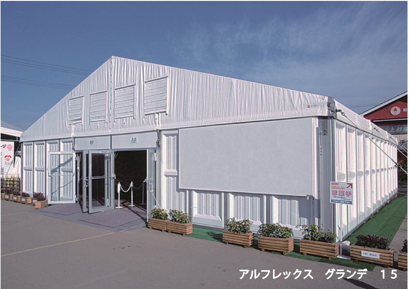
アルフレックス グランデ 15